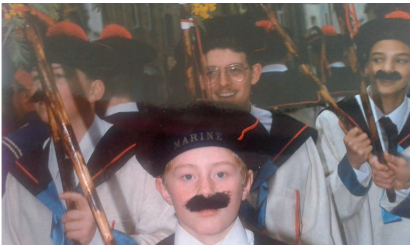
Dimanche Gras 1990

Depuis hier, je ne cesse de relire ton joli message à propos de mon reportage réalisé lors de votre barbecue annuel ! Je te remercie pour la reconnaissance, la confiance accordée envers ma passion et surtout de m'avoir intégrée au sein de la société. Je pense très fort à tes parents, à tes proches et aux amis de la société des Indépendants qui devront affronter cette dure épreuve de la vie et je te souhaite bon voyage l'Ami.