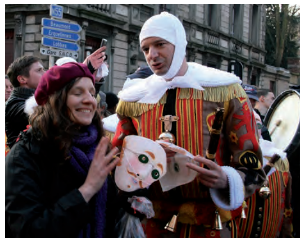
Mardi Gras 2013