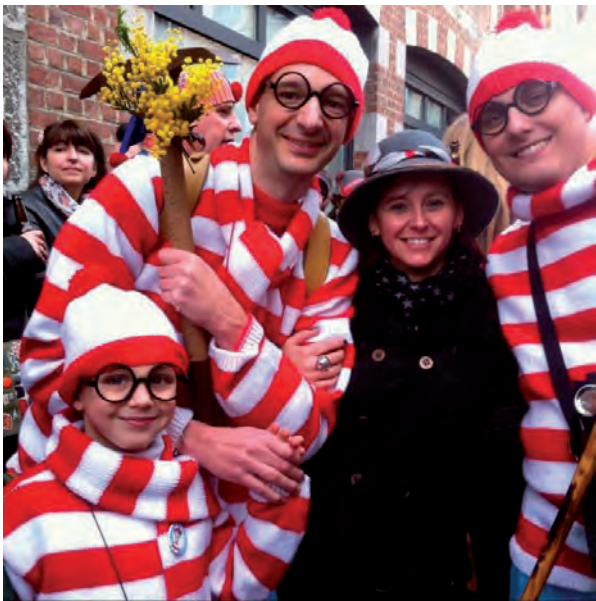
Dimanche Gras 2015

Un homme bon, une grande simplicité, une ouverture envers les autres, de la compétence, de la gentillesse, de l'humilité, toutes les qualités d'un grand président. Une perte injuste... Je me joins à vous dans cette triste nouvelle et vous remets mes condoléances pour la perte d'un homme remarquable. De tout coeur avec la famille et les membres de votre si belle Société. Merci monsieur le président.