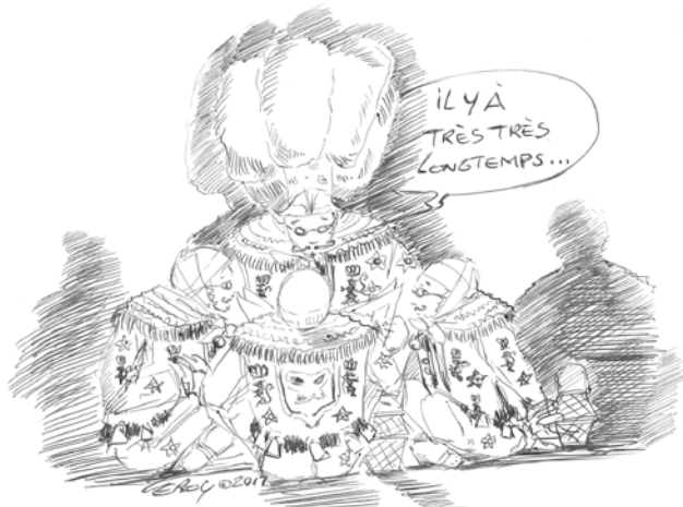
Image du passé

«Faire toutes les chapelles », qu'ils disaient : 40 arrêts lors du Mardi-Gras! Cet itinéraire des années 20' nous transporte vers une glorieuse époque où notre société se rassemblait le matin chez un de ses gilles (cette année-là, chez le président) et s'arrêtait tantôt dans un café, tantôt chez un des membres. A noter le matin que la descente de la gare empruntait la rue de Robiano et que les sociétés n'étaient pas reçues à l'Hôtel de Ville. Tout aussi curieux, notre musique terminait bien après la fin du cortège du soir, lequel avait eu pour point de départ ... Battignies.