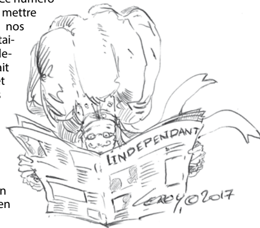
Illustration Martin Leroy © 2017

Maintenant que la valse des barbecues et banquets a pris fin, nous voici de retour vers notre environnement naturel: ces bons vieux pavés dans notre vieille ville de Binche. Les rendez-vous vont vite se succéder jusqu'à l'apothéose du Mardi Gras.